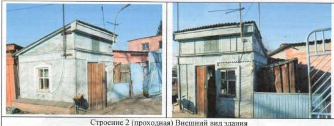
Строение 2 (проходная) Внешний вид здания