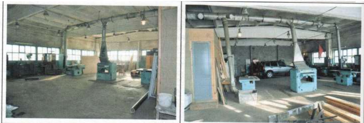
Строение 3 (Цех)