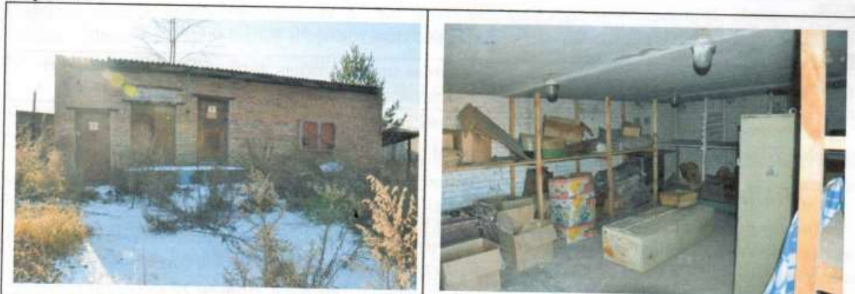
Строение 4 (цех, склад) Внешний вид здания