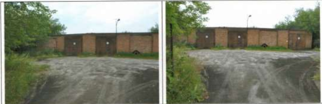
Общий вид здания