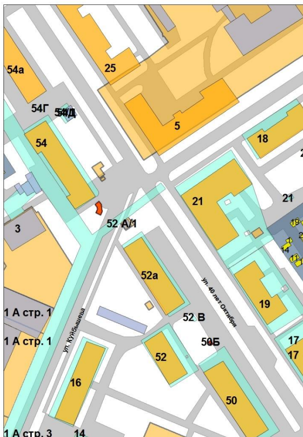
Схема расположения некапитального объекта, подлежащего демонтажу

Приложение 1 к постановлению Администрации г. Канска от 29.06.2020 г. № 562